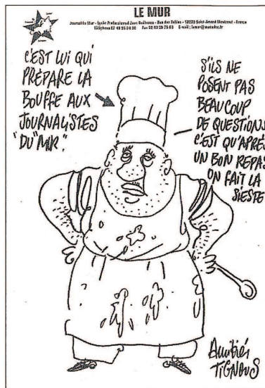
▣ Tignous avait offert un dessin au journal lycéen saint-amandois Le Mur lorsque quelques élèves avaient été accueillis à Charlie Hebdo .